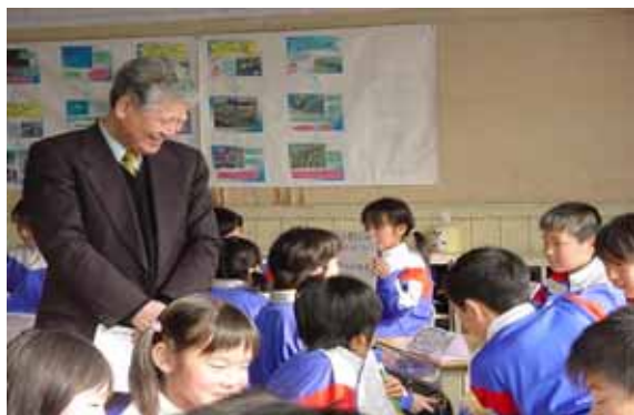
4・5年生の授業(水族館の引継ぎ)を参観