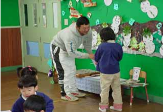
幼稚園 5 歳児の保育体験 「かるたをつくろう」

3学期に幼小連携交流の一環として互いの教育内容の理解を深め合おうと、小学校の先生2名が幼稚園で幼稚園の先生2名が小学校で互いに授業体験をしました。