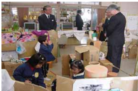
幼稚園の保育(おうちごっこ)を参観

2月3日、文部科学省の鳴島視学官、県教育委員会の方々5名が来校され、授業での子供たちの活動の様子(幼稚園も)や水族館、かち込み井戸等の水環境を視察されました。視学官はかち込みの井戸掘りや藻刈り十字軍など、これらの活動が地域と一体となった取り組みであることに深く感動されました。文部科学省視察は子供達、先生達にとって来年度の教育活動の充実、発展への励みとなりました。