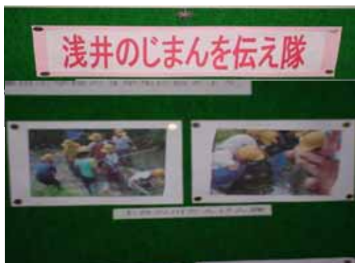
浅井のじまんを伝えよう

3年生は2学期の総合的な学習で「浅井のじまんを伝え隊」をテーマに浅井のじまん、よさを調べてまとめ、伝える活動をしました。9月には川探検、お年寄りとの交流体験、10月には自分が調べたい活動、そして11月にはホームページ作りに取り組みました。子供たちは浅井のよさを見つけ、「こんなにも浅井にはじまんできるものがあるんだね。米や川や魚などの生き物は水とのかかわりがあるんだね。」とより一層地域のよさに気付きました。