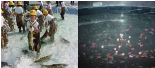
サケのつかみどり