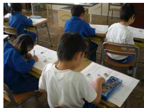
付け加えカードを書く子供たち