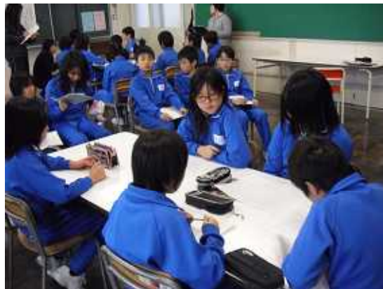
話し合いグループと、それを見る観察グループ