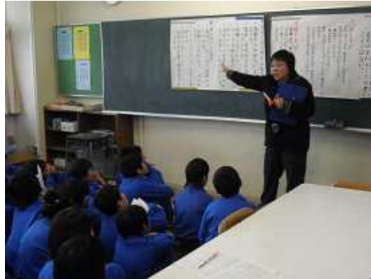
本時の目当てや話し合いの仕方の確認