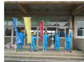
「名前+挨拶」の挨拶運動 — 人権意識の高揚 —