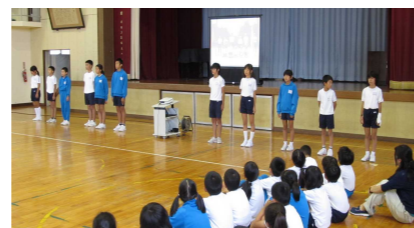
表現力を高めるために — チューズデー集会 —