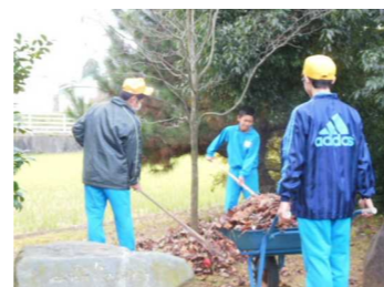
学校への恩返し — ボランティア活動 —