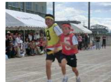
体力・運動能力の向上 — 全校リレー —