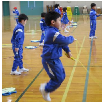
〈なわ跳びの練習に励む子供たち〉

それを見て、できないと言っていた子供たちも根気よく練習を続けるようになってきました。難しいことがあっても友達の姿や言葉を励みにして努力する姿に、1年生の成長を感じました。