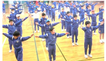
〈ポーズを決める子供たち〉

これからもサンバの踊りのように、友達と息を合わせて活動する楽しさを実感できるよう支援していきます。