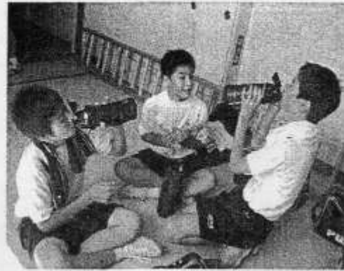
↑つかのまの休息 男子卓球部