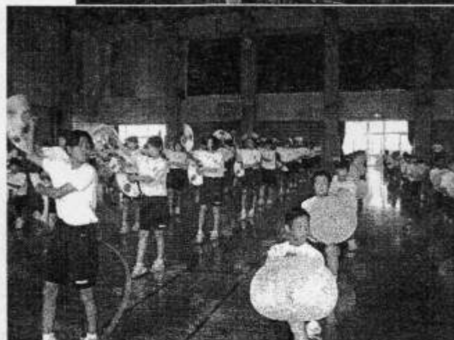
↑顔がきりっとしていいですね。