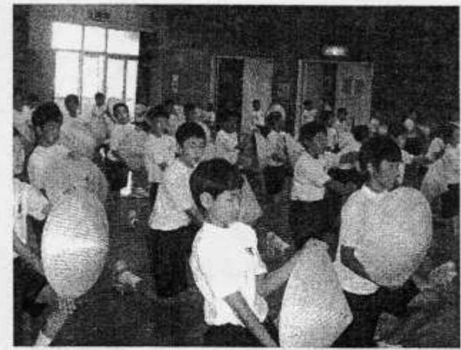
↑男子の笠踊りも随分上手になりました。