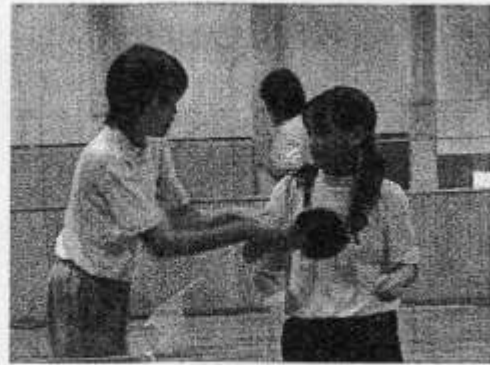
↑先輩の優しい指導 女子卓球部