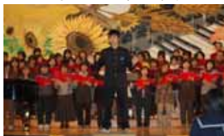
<育成会・生徒合同合唱>