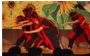
<よさこいソーラン>