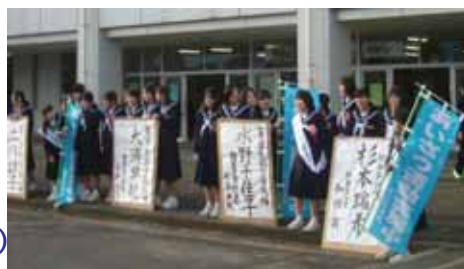
< 朝の選挙運動 >

私は、滑中生が生き生きと充実した学校生活を送れるように、生徒の意見をより多く取り入れて一人一人の思いが反映された学校を作り上げていきたいです。地域の人たちに滑中のことをもっと知ってもらえるように地域の人と触れ合えるイベントを学校行事に盛り込んだり、ボランティア活動にも積極的に参加していきたいです。生徒の笑顔が一つでも多くなるように頑張ります。よろしくお祈りします。