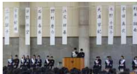
< 立ち会い演説会 >