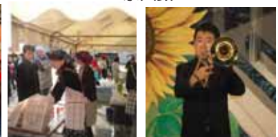
<育成会バザー> <トロンボーン演奏>