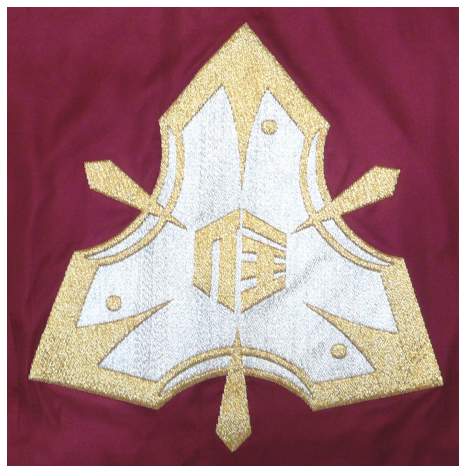
魚津市立住吉小学校の校章