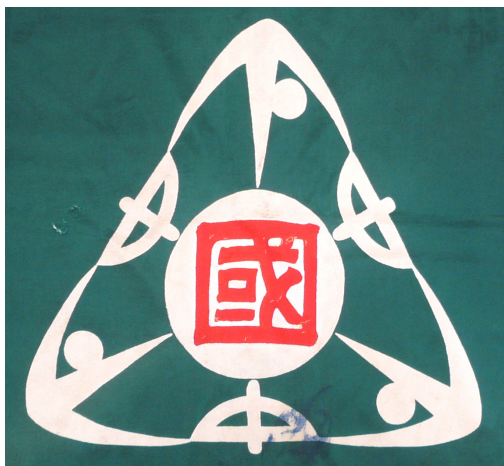
下中島国民学校の校章

本校は、創校133年になる歴史と伝統のある小学校である。富山県下新川郡下中島国民学校から、昭和27年4月1日に魚津区域12か町村の合併によって魚津市になり、魚津市立下中島小学校と改称した。その後、昭和29年10月1日、魚津市立住吉小学校と改称した。