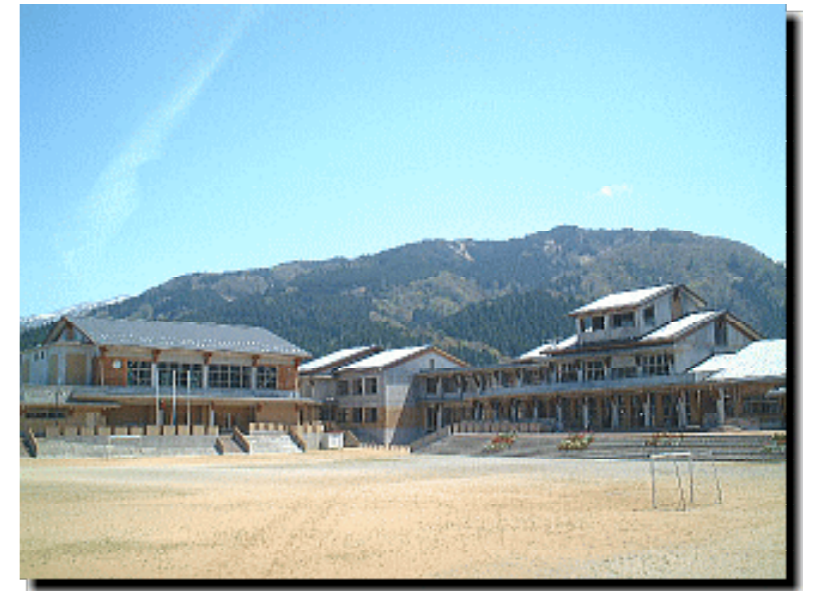
片貝小学校・保育園複合施設の全景