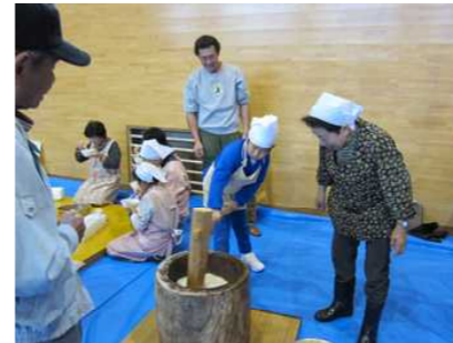
三世代交流もちつき大会