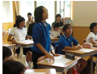
学びを楽しむ学習