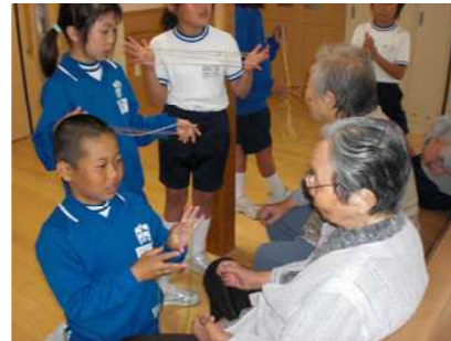
片貝ヴィーラとの交流