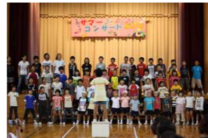
サマーコンサート