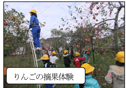
りんごの摘果体験