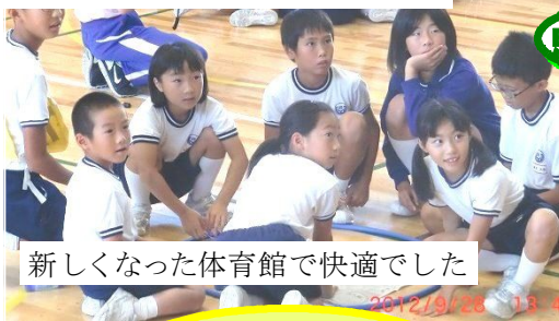
新しくなった体育館で快適でした