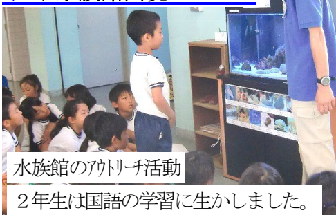
水族館のアウトリーチ活動