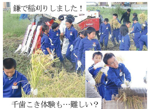
鎌で稲刈りしました!