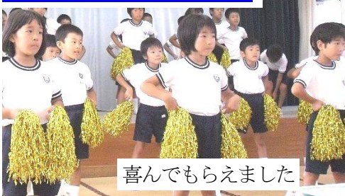
喜んでもらえました