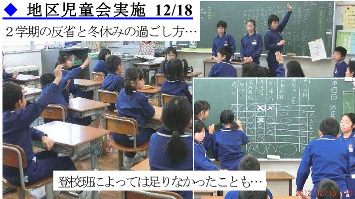
登校班によっては足りなかったことも…