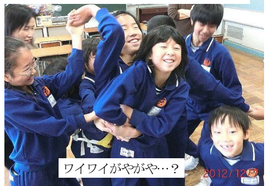
ワイワイがやがや…?