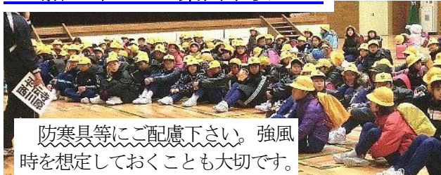
防寒具等にご配慮下さい。強風時を想定しておくことも大切です。