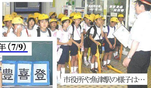
市役所や魚津駅の様子は…