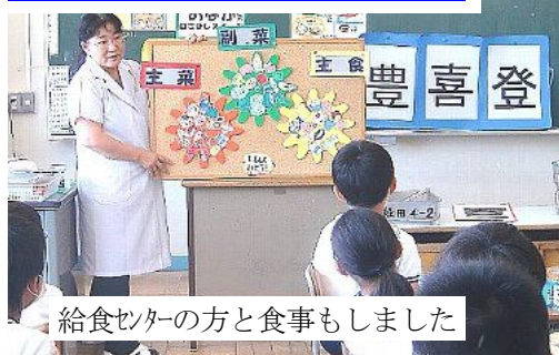
給食センターの方と食事もしました