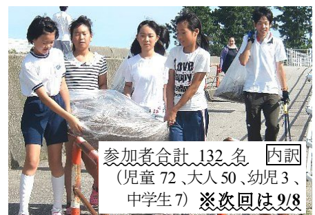
参加者合計 132名 内訳 (児童 72、大人 50、幼児 3、 中学生 7) ※次回は9/8