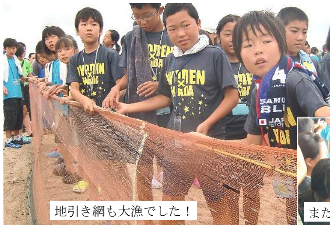
地引き網も大漁でした！

天候にも恵まれ、大変素晴らしい交流でした。長く子どもたちの記憶に残ることでしょう。