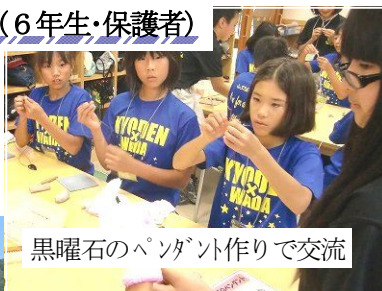
黒曜石のペンダント作りで交流

和田小の歓迎ぶりに感激しました。子どもたちや保護者の皆さんにとっても一生の思い出になることでしょう。