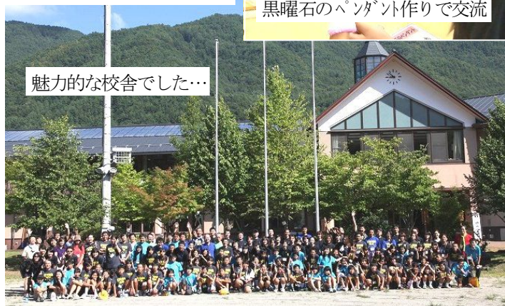
魅力的な校舎でした…