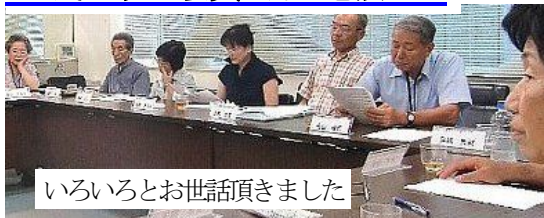
いろいろとお世話頂きました