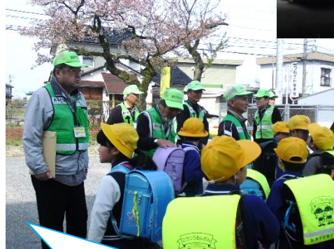
「上級生のお姉さん、ありがとう」