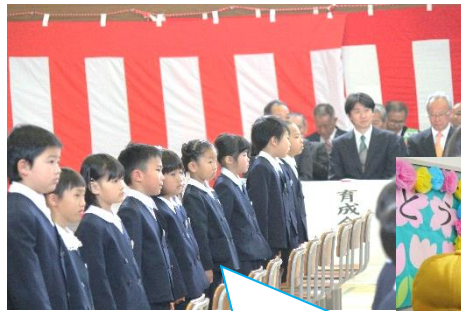
入学式「よろしくおねがいます」

高学年は、5月に行われる魚津市小学校体育大会に向けて、朝や放課後に、一生懸命ハードルや100m走の練習に取り組んでいます。日に日に力強くなるその走りに、頼もしさを感じられます。大会で自己ベストが出ることを期待します。