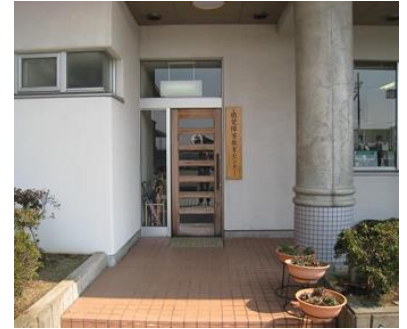
<聴覚障害教育センター入口>

また、補聴器店や耳鼻科専門医による相談日も設けています。どなたでもお気軽にご相談ください。