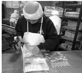
パン工場 (ラベル付け)

「あいさつ・返事・報告をする」「話を聞いて正確に仕事をする」「続けて仕事をする」などの実践的な働く力を身に付けます。