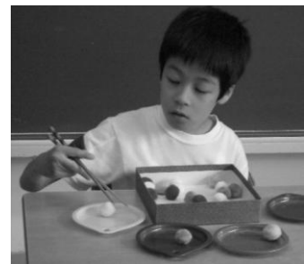
手指の巧み性を高める活動