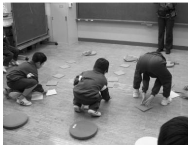
めくれめくれゲーム

いろいろな遊びを通して、友達や教師とのかかわりを促し、意欲的に活動する態度を育てます。