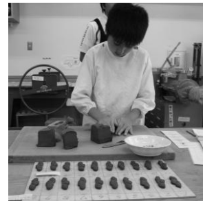
(陶芸班) はし置きづくり

一人一人の適性に合った作業班(陶芸、紙工、木工、縫製、調理、園芸)で、働く力や生活する力を高めることを目指します。